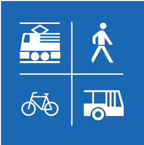
61% der kantonalen Angestellten kommen per ÖV, Velo oder zu Fuss zur Arbeit

Die Mitarbeitenden des Kantons Zug pendeln schon heute zu rund 2/3 mit dem öffentlichen Verkehr, zu Fuss oder per Velo zur Arbeit. Zudem besitzen 80% ein Abo des öffentlichen Verkehrs. Diese erfreulichen Ergebnisse ergab eine Umfrage bei allen kantonalen Angestellten vor einigen Jahren. Mobilität spielt aber nicht nur beim Pendeln eine Rolle. Deshalb will der Kanton mit dem Mobilitätsmanagement weitergehende Massnahmen fördern, die zu einer effizienten, umwelt- und sozialverträglichen Mobilität beitragen. Mobilität soll ermöglicht, die Belastungen durch den Verkehr gleichzeitig verringert werden. Nachfolgend finden Sie einige Hinweise, Tipps oder Ideen, wie Sie als kantonale Angestellte oder kantonaler Angestellter den Kanton in seinem Bestreben unterstützen können.