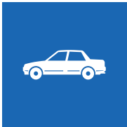
39% der kantonalen Angestellten kommen noch mit dem Personenwagen zur Arbeit

Fördern einer effizienten, ökologischen und sozialverträglichen Mobilität